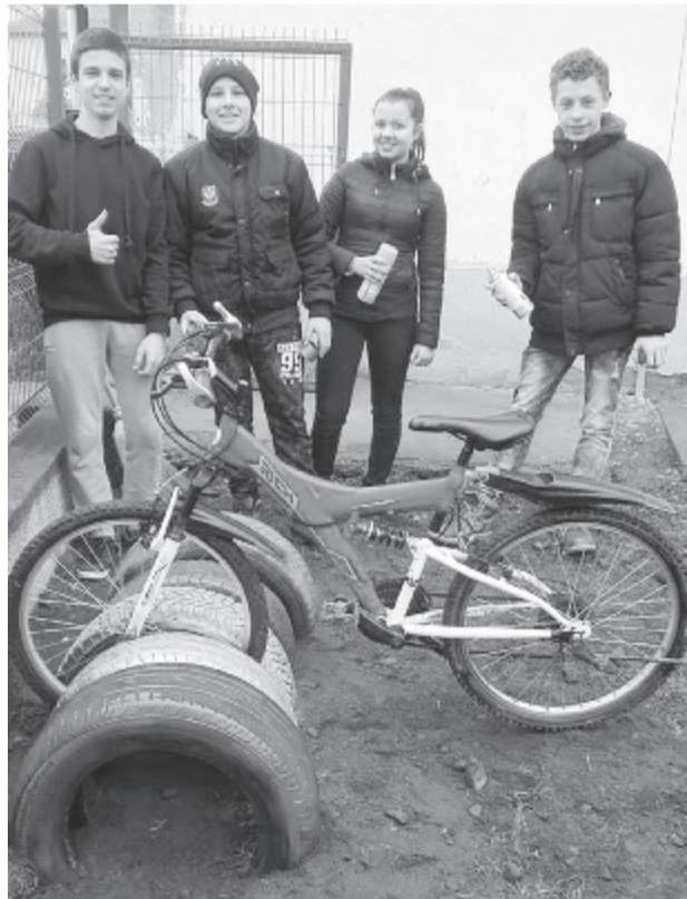
A csíkfalvi diákok ötletes kerékpártárolót készítettek