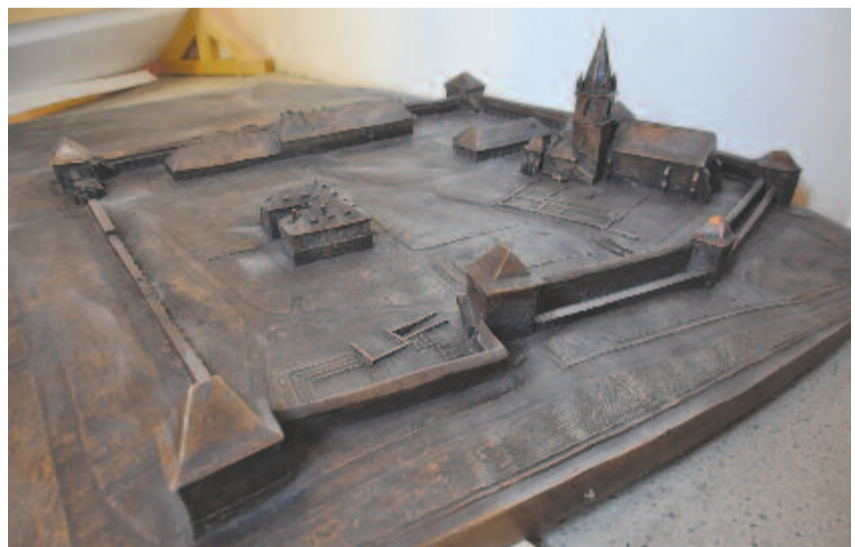
A vár bronzmakettje

– Tavaly befejeztük a leletmentést az autópálya és a marosvásárhelyi terelőút nyomvonalán. Egyelőre nem tudunk olyan beruházásról, ahol igényelnek régészeti leletmentést. Kisebbségi régészeti felügyeletnek vannak kilátásban, de kicsi az esélye annak, hogy valamilyen jelentős lelőhelyre bukkanjunk. Ha sikerül pályázati támogatáshoz is jutnunk, akkor Mikházán a római castrumnál és Nyárádszentlászlón az unitárius templom körül folytatjuk az ásásokat.