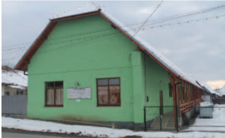
A roma központ

Másik megnyert pályázatunk a makfalvi kultúrotthon felújítása. Ezt azért tartottuk szükségesnek, mert a tetőzete nagyon gyenge, és ha tovább romlik, hamarosan be kellene zárjuk. Ennek a pályázatnak az értéke 3.527 ezer lej. Teljes tetőcserét, a terem, az öltözők teljes felújítását tervezzük, illetve egy új hőközpontot.