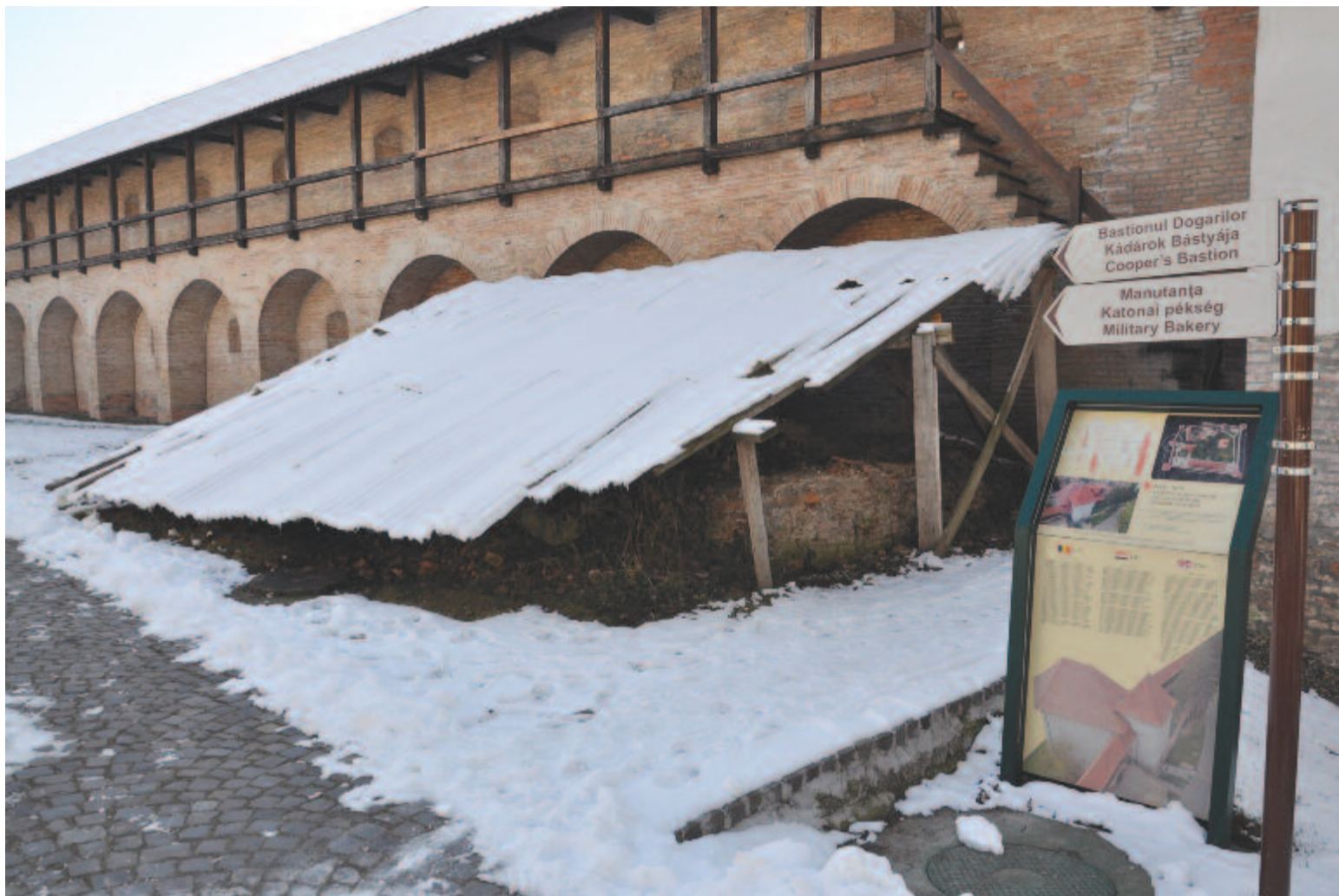
Az újjáépítésre váró kemence